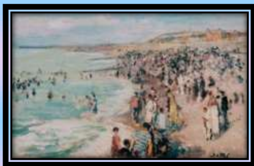
Jacques-Emile BLANCHE, Plaža v Dieppu