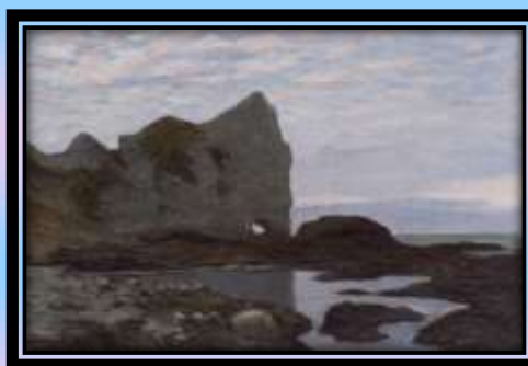
Claude MONET, Etretat

Vir: http://www.ng-slo.si/si/razstave/razstava/slikati-v-normandiji?id=3176