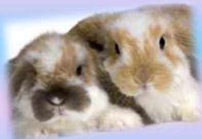
SLIKA 1: domači kunec ( http://www.viva.si )