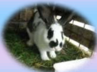
SLIKA 2: domači zajec